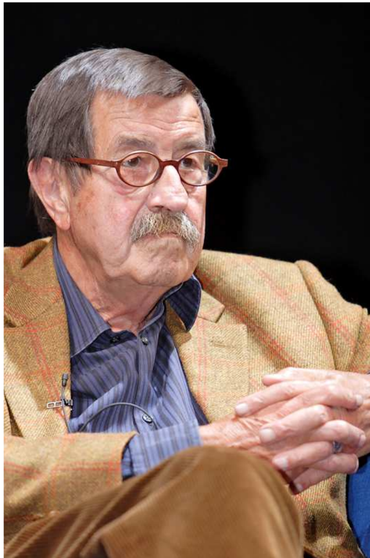
Günter Grass sur le canapé bleu (Blaues Sofa, 2006)

2010 - 2013 : parution d'oeuvres lyriques et de sa correspondance avec Willy Brandt