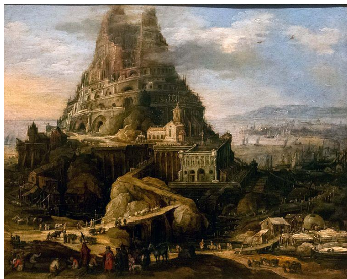
Tour de Babel (1595-1605), Joos de Momper

Source : Wikimedia Commons http://bit.ly/2EIMhqe