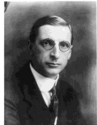
Eamon de Valera

Photographies ci-dessus : trois des sept membres du gouvernement provisoire d'Irlande de 1916, signataires de la proclamation de la République d'Irlande la même année, et Eamon de Valera, l'un des chefs de l'insurrection et troisième président irlandais.