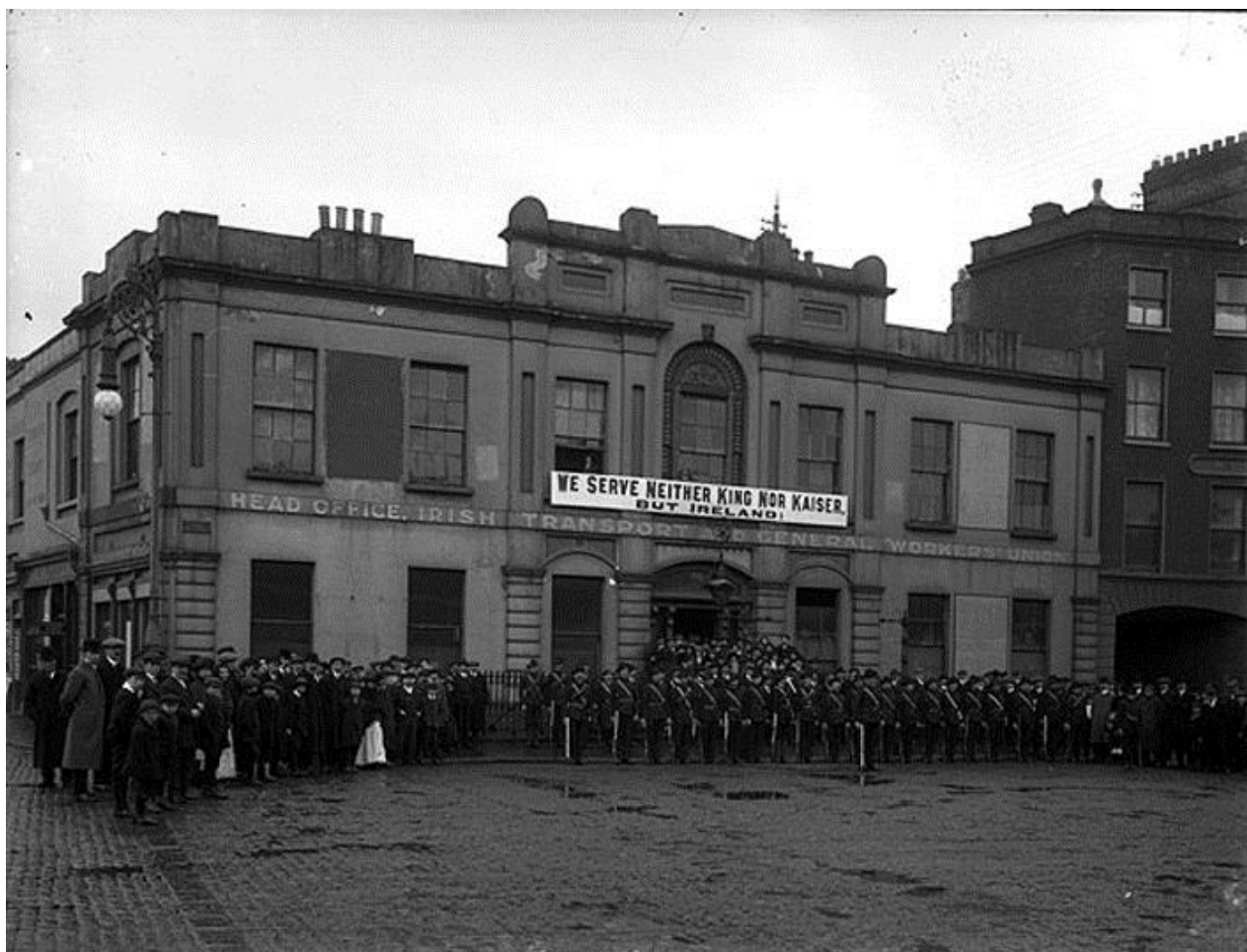
Groupe de l'Irish Citizen Army