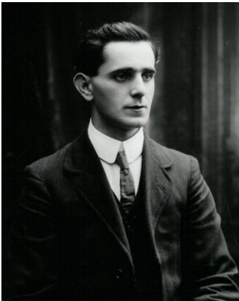
Seán MacDiarmada (John McDermott)