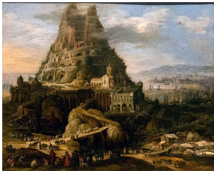
Tour de Babel (1595-1605), Joos de Momper