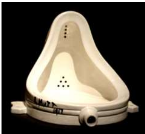
« Fontaine » de Marcel Duchamp, 1917

https://fr.wikipedia.org/w/index.php?title=Fontaine_(Duchamp)&oldid=142558449