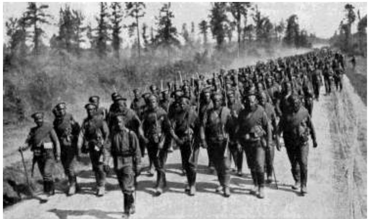
1) Les troupes vont au front, Georges H Mewes, 1923

31 juillet : Mobilisation générale de l'armée russe.