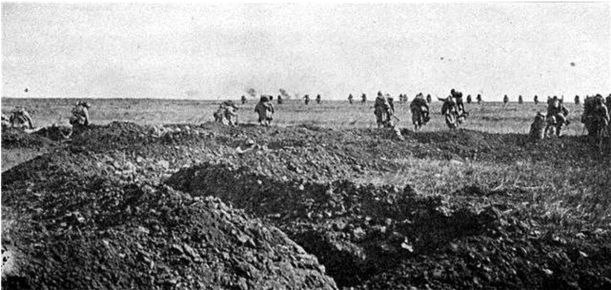
Assaut au chemin des Dames

« Les dates clés de la bataille du Chemin des Dames », Mission Centenaire 14-18 , 10 février 2017.