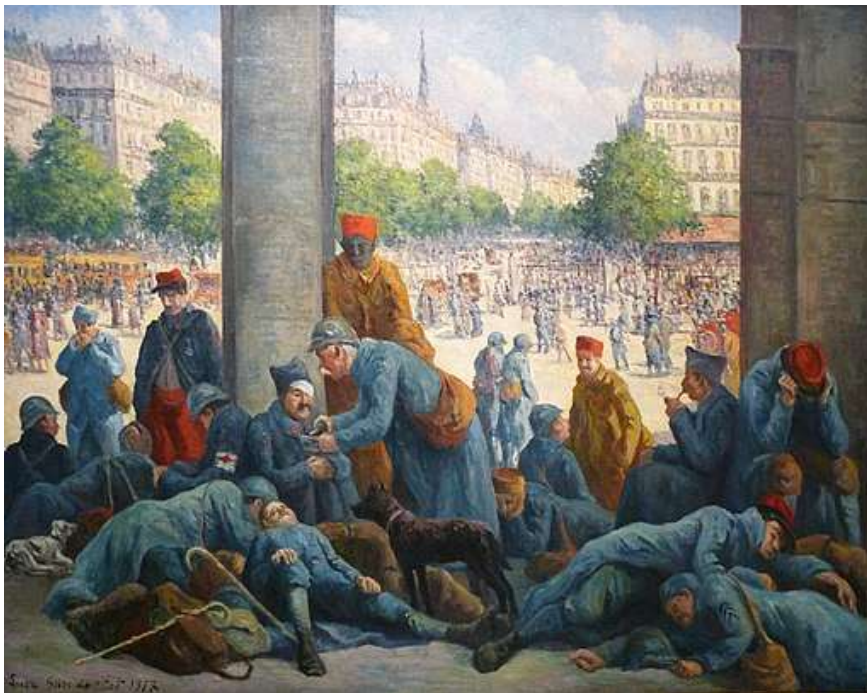
Maximilien Luce – La gare de l'Est – 1917