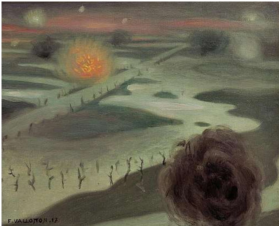
Félix Vallotton, L'Yser (1917)

Joyeux-Prunel Béatrice, « La guerre des avant-gardes parisiennes - (Chapitre XII) », in Les avant-gardes artistiques, 1848-1918 : une histoire transnationale , Paris : Gallimard, 2015 (Folio. Histoire, 249), pp. 537-591.