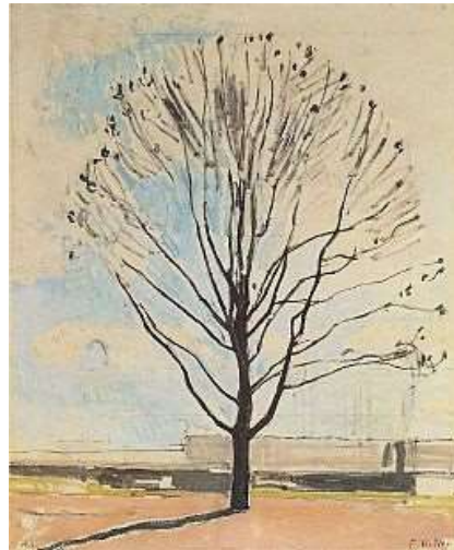
L'arbre nu, 1917