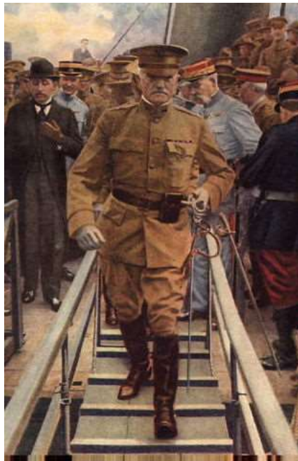
Arrivée du général John Pershing à Boulogne-sur-mer