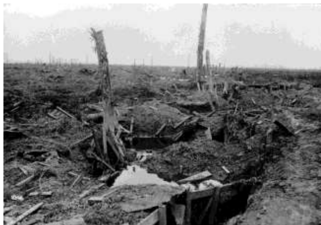
Champ de bataille à Armentières (France)