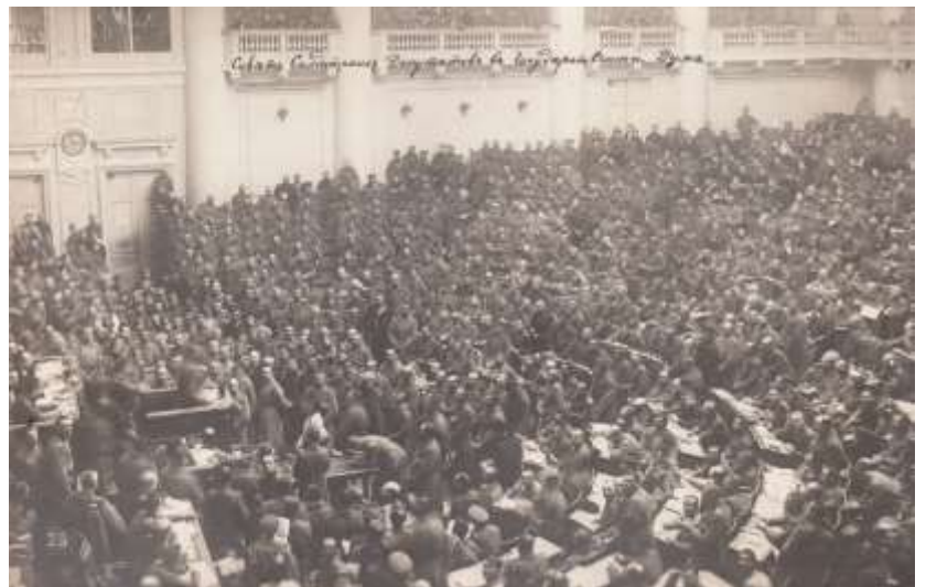
4) Assemblée du soviét de Petrograd, 1917

Mars : Début de la révolution à Petrograd, des militaires se rebellent et s'allient aux révolutionnaires.