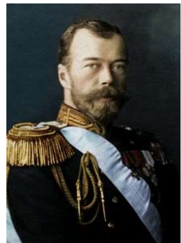
3) Nicolas 2, 1912

Septembre : Le tzar Nicolas II prend le commandement de l'armée.