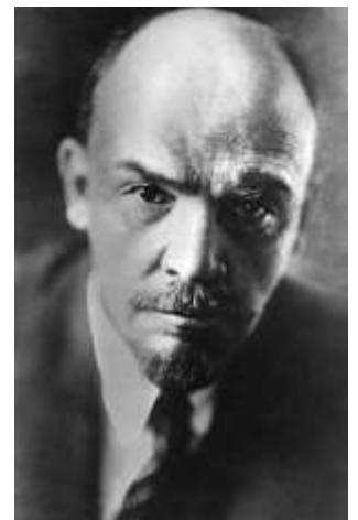
5) Wladimir Iljitsch Lenin, Pavel Semyonovich Zhukov, 1920

16 avril : Lénine et d'autres dirigeants bolcheviques rentrent d'exil.