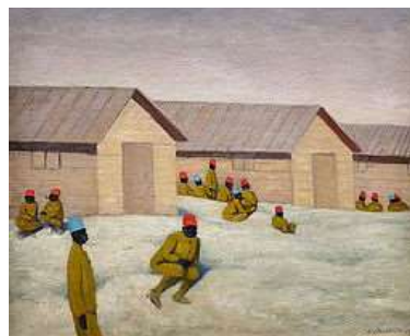
Soldats sénégalais au camp de Mailly, 1917