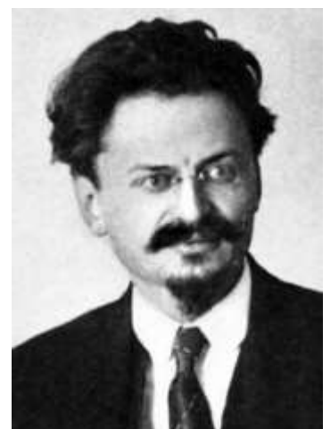
5) Lev Trotsky, 1921

3 mars : Paix de Brest-Litovsk entre la Russie et les empires centraux : perte de la Pologne, des pays baltes, de l'Ukraine et de la Finlande.