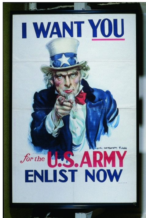
Affiche de propagande « I want YOU for the U.S. Army – Enlist NOW ». J. M. Flagg, 1917. Etats-Unis.

En 1917, le positionnement du gouvernement américain face aux conflits prend un tournant. La neutralité de 1915 ayant fait place en 1916 à une participation commerciale et financière, des attaques allemandes ont lieu contre la flotte marchande américaine. Cela va pousser les États-Unis, avec à leur tête le président Wilson, à entrer en guerre aux côtés des Alliés. Cet engagement américain aura un impact dans les milieux littéraires américains avec l'émergence de ceux que l'on nommera la « Génération Perdue ».