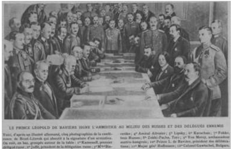
4) Signature et négociation du traité de Brest-Litovsk, Anonyme, 1918

22-28 décembre : Début des négociations de paix à Brest-Litovsk.