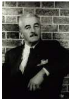
William Faulkner (1897-1962)