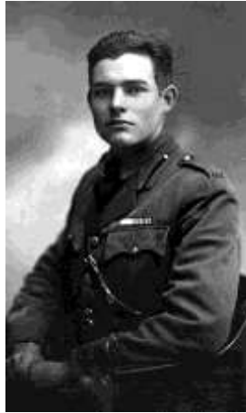
Ernest Hemingway (1899-1961)

Hemingway Ernest, A farewell to arms , London : Vintage, 1999 (Vintage international), 294 p.