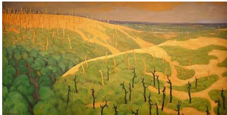
Le Bois de la Gruerie et le ravin des Meurissons, 1917