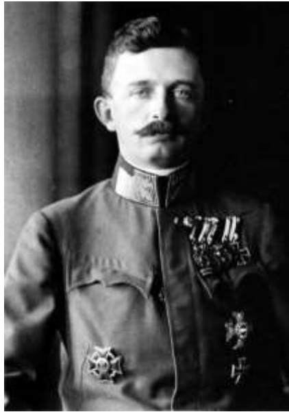
L'empereur Charles 1 er

« 29 janvier 1917 - Charles 1er échoue à faire la paix », Herodote.net , 2016.