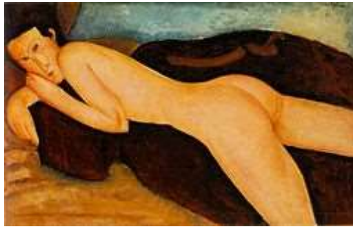
Nu couché de dos, 1917

Ducrey Marina, Vallotton , Milan : 5 Continents, 2007 (Galerie des arts, 10), 112 p.