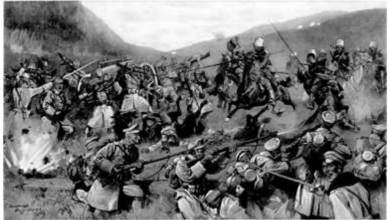
2) Affrontement en Hongrie entre une force austro-hongroise et un corps de cavalerie russe qui avait traversé les Carpates depuis la Galice, 1914

26-30 août : Bataille de Tannenberg (Prusse orientale), victoire allemande.