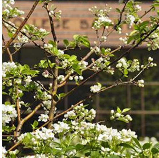
Cour de la Bibliothèque Sainte-Barbe au printemps

Sur les notions proches de la nature, vous pourrez également consulter avec profit la bibliographie en ligne « Environnement et développement durable ». Elle est aussi disponible en version papier dans les salles de lecture.