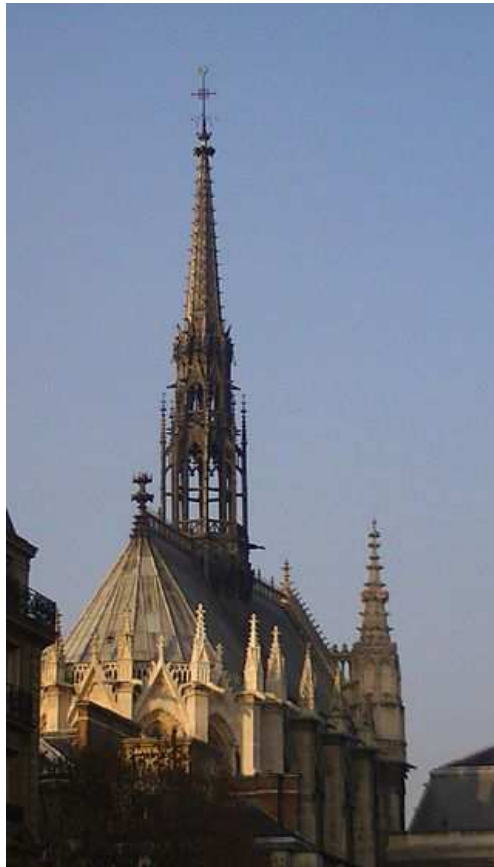
Sainte-Chapelle à Paris

Adam Bishop - Licence CC BY-SA 3.0 - Travail personnel